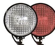
фары на СИМ